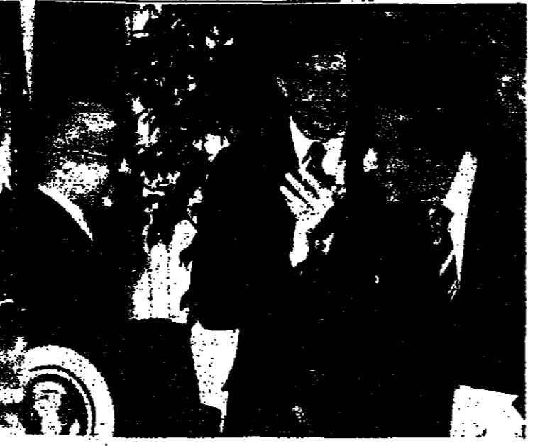
سفيرا مصر واسرائيل في واشنطن ، اشرف غريال واقراميم عبرون اثناء الحفل الذي اقامه الرئيس كارتر فجر امس في البيت الابيض بمناسبة مرور عام على توقيع معاهدة السلام المصرية الاسرائيلية .

مجد الكروم - من مجد كتمان - قام مجلس دير الاسد المحلي بنزوح منح دراسية ، قيمة كل منها ثلاثة الف ليرة على طلاب القرية الذين يتعلمون في الماهد العليا خارج البلاد واعددهم 11 طالبا . وقد حضر حفل التوزيع رئيس واعضاء المجلس المحلي ومدراء المدارس واولياء المسور الطلاب ولقيهم من وجهاء القرية .